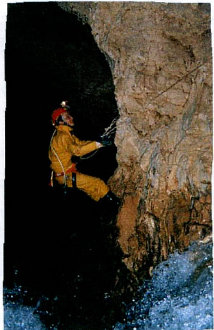
Passage de main courante à la Grotte du Bournillon.

Mais de dire aussi que ce trou est sur une liste de sites archéologiques sur lesquels tout travail de désob est interdit ; que cette liste comporte des dizaines et des dizaines de cavités dans la région (mais on n'a pas vu cette liste) ; et que si elle en avait les moyens, la DRAC fermerait toutes les entrées de grottes... !