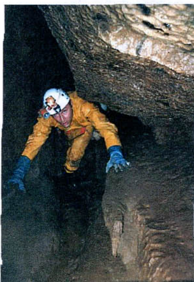
Progression dans une galerie en Lozère

Les 7 rédacteurs et 31 ans de CDS-Info en chiffres.