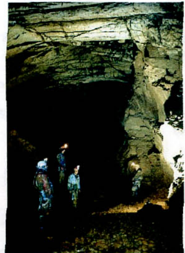
Le Gouffre de Longirod (Suisse), lors de la sortie CDS.