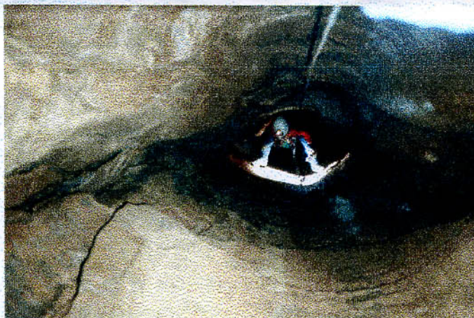
La Cheminée de Sermu.