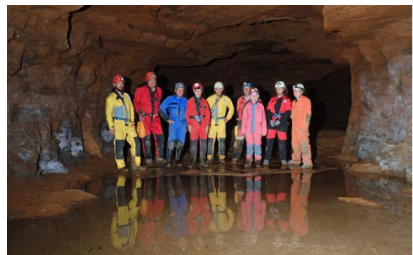
Mines d'Ougney

Le bilan est simple : cela nous enseigne que nous devons poursuivre nos actions afin d'être prêts car le Jura n'est pas exempt d'événements liés au monde souterrain.