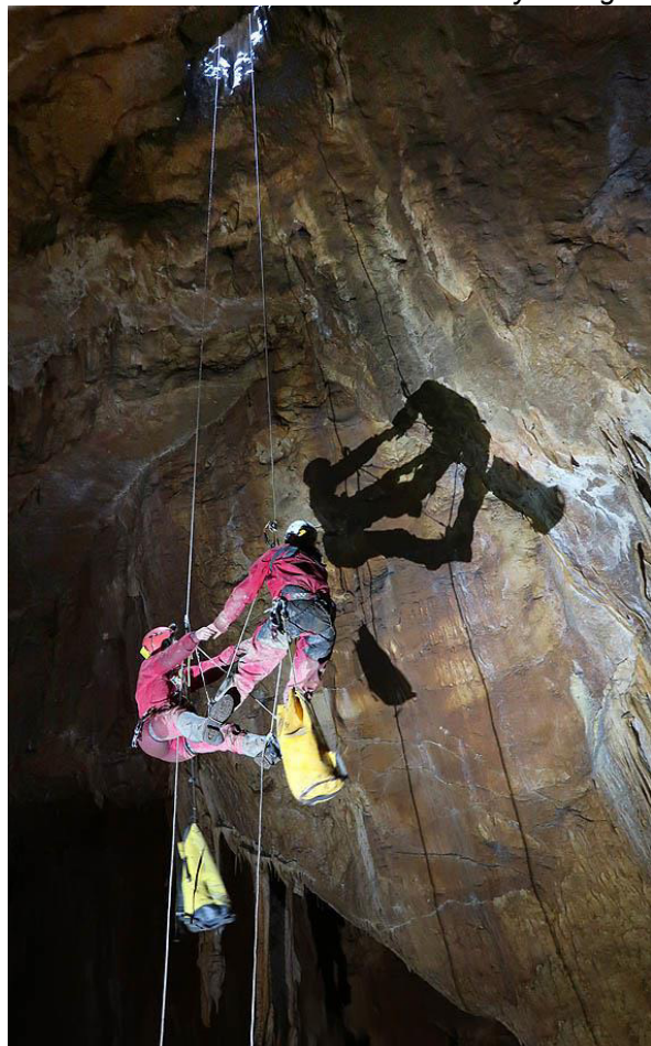
« Danse sur corde », gouffre des Orçons (25)